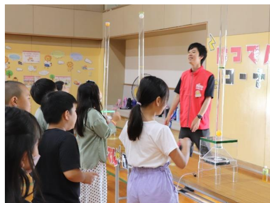
電気を発電し、風を発生させ電気の見える化を体験