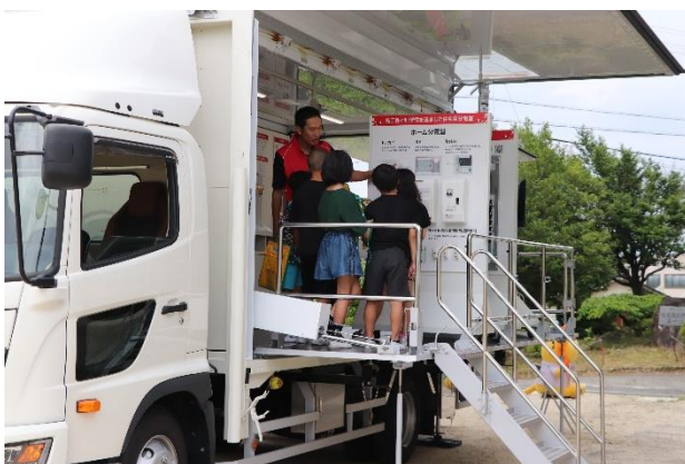
展示車で製品を身近に見学