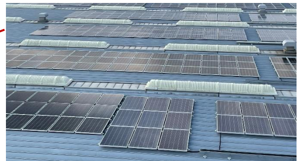
太陽光リユースパネル 1,115 枚（5 種類の異なる仕様）設置