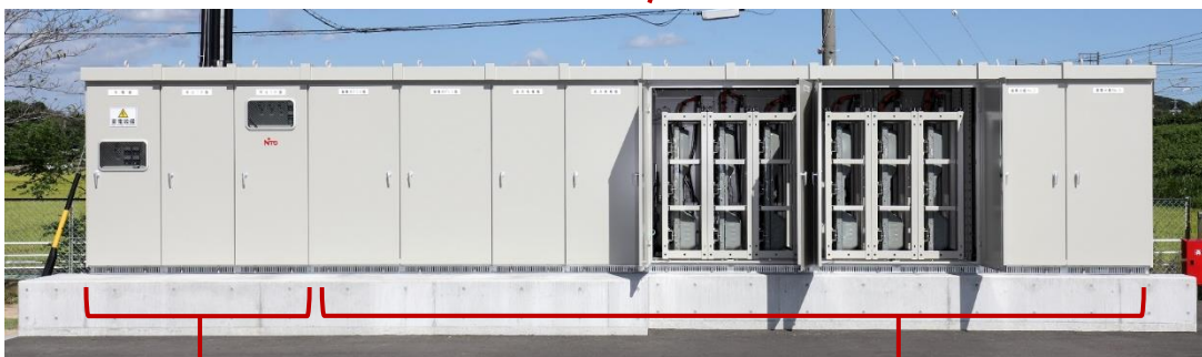
既存キュービクル