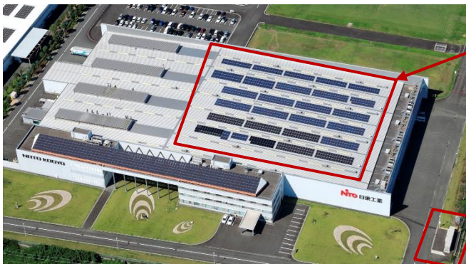
掛川工場（静岡県掛川市）

日東工業は、再生可能エネルギーで発電された電気を蓄電池と組み合わせて自家消費することでCO 2 削減を進めていくことは勿論、これらリユース品を使用することで、環境負荷の低減にも貢献していきます。