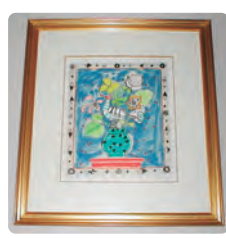
青い基調の鳥と花束 (ハセガワアイズピロウ作)