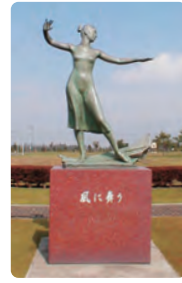
風に舞う (轟見香治作)