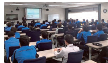
▶フォークリフト安全講習会

危険予知訓練(KYT)、ヒヤリハット報告などの安全活動による従業員の安全意識の向上、リスクアセスメント活動によるリスクの低減、安全衛生・5S巡視、産業医巡視、経営トップ層による巡視などの職場巡視活動、メンタルヘルス教育の実施など、健康で安全に働ける職場づくりに努めています。