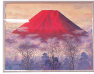
赤富士 (鈴木政夫作)