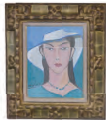
海辺の女 (池田満寿夫作)