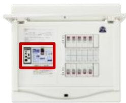
感震機能付ブレーカー搭載 ホーム分電盤（新設用）