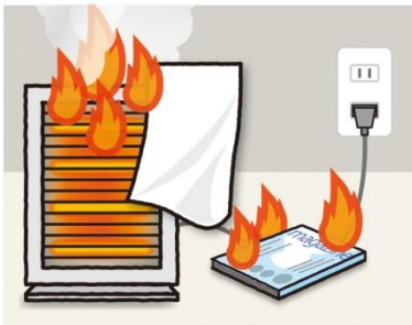
復電後、電気製品に落下した 可燃物から発火

停電が発生し、その後電気が復旧した際、可燃物が落下した電気ストーブや破損した電源コードなどに再び電気が通ることが原因で火災が起きる現象。