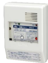
感震ブレーカー・分電盤タイプ（既設用） （感震リレー MG4）