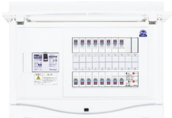
感震ブレーカー・分電盤タイプ（新設用） （感震リレー付ホーム分電盤）

東日本大震災では地震による火災の66%（※2）が電気関係の出火とされており、大地震発生後の電気復旧時に発生する「復電（通電）火災」を防ぐ有効手段として「感震ブレーカー」が近年注目され、設置費用に対する補助金制度を導入する地方自治体も少しずつ増えています。